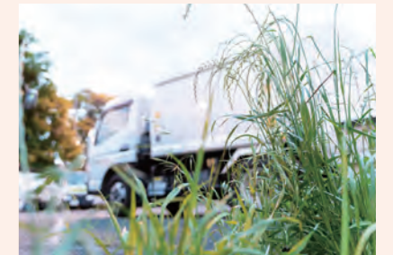
インフラ施設の駐車場