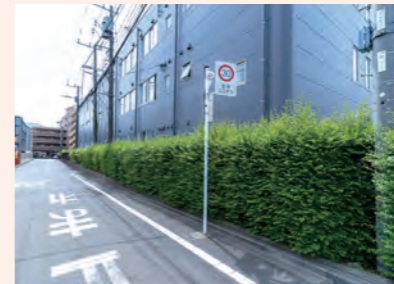
インフラ施設の建物周辺