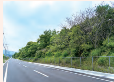
のり面及びインターチェンジ周辺